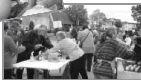
Un pique-nique familial précédait le grand tirage prévu à 16 h.