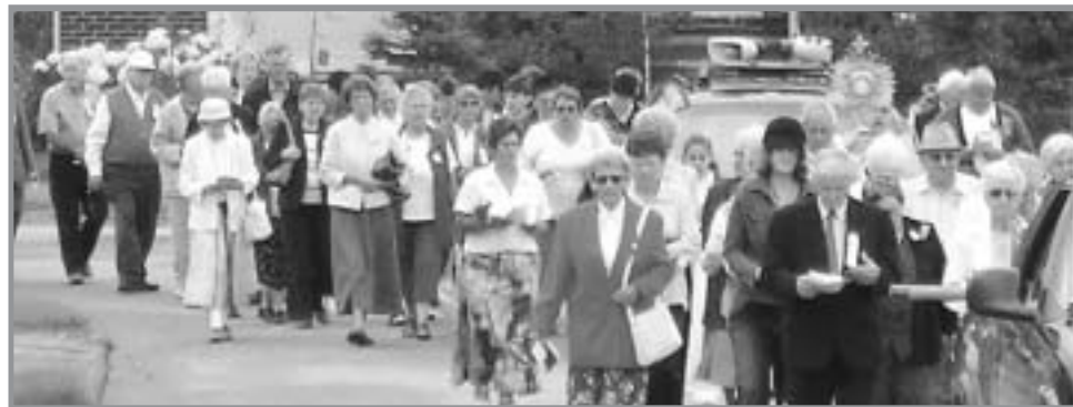
Les pèlerins en procession dans les rues de Sainte-Anne-du-Lac