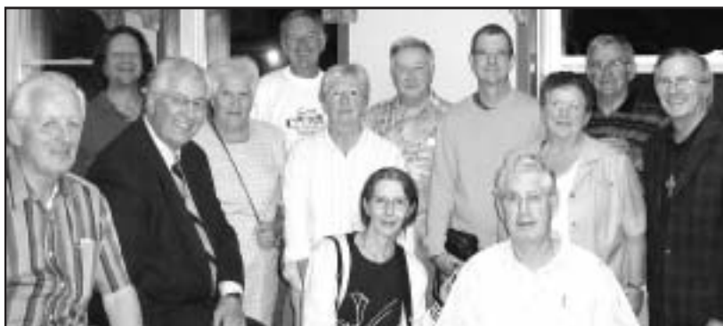
De retour du Congrès, une quinzaine de participants se sont exprimés sur leur expérience.

La question était de se demander aussi: et après? Déjà plusieurs ont manifesté le goût de dire plus ouvertement ce qu'ils sont et de ne pas avoir peur de témoigner de leur foi. « Devenir présence réelle », « Nous sommes le Corps du Christ », « Chaque matin je me demande comment puis-je être présence du Christ ». Aussi, plusieurs sentent le besoin d'accorder plus de temps à la prière, à la méditation, à la contemplation, à l'adoration. Ayant reçu davantage au cours de cette expérience de foi unique, il semble qu'il va de soi que tous veulent tout au moins accomplir un agir concret dans leur milieu pour que Dieu soit mieux connu et aimé.